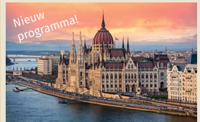
Langs de blauwe Donau

Dank U, Vader, voor deze mooie, wereldwijde familie van Radio Maria!”